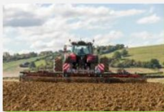
Outils à disques