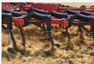
Outils à dents

Un programme dédié aux utilisateurs se déroulera sous la forme de 3 ateliers. 3 pôles et 3 thématiques distinctes: un atelier Techniques Culturelles et Coûts d'Utilisation, un atelier Technique Machine réglages et configurateur et enfin un atelier Services, pièces, démo et supports digitaux sans oublier des essais aux champs.