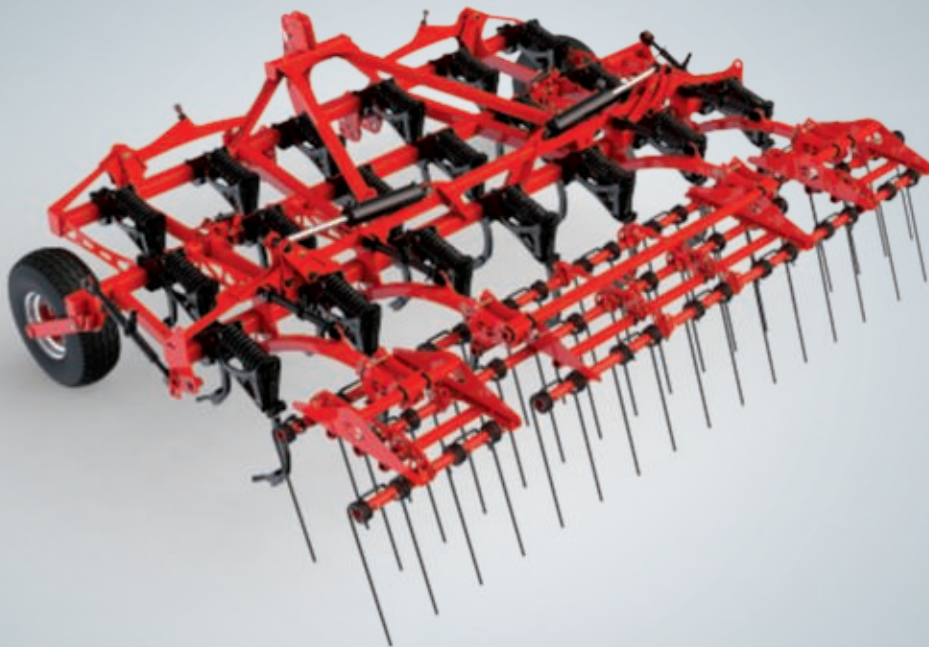
Crossland 4.40 m - 19 Zinken - Striegel - großdimensionierte Tiefenführungsräder