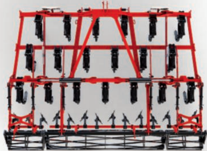
Crossland 4.40 m - 19 Zinken - Planierscheiben und Stabwalze